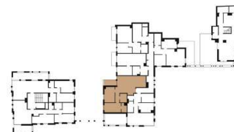
Rzut piętra +3