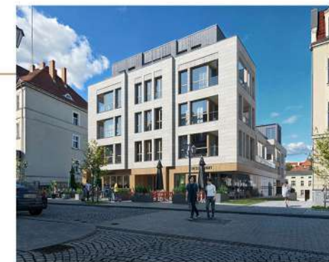
Widok budynku od strony ul. Kościelnej