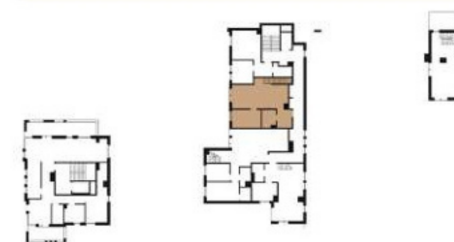
Rzut piętra +4