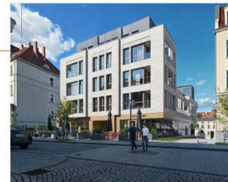
Widok budynku od strony ul. Kościelnej