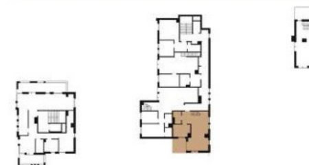
Rzut piętra +4